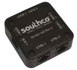
安全系统集成接线盒图纸 (零件编号EA-A01-102)